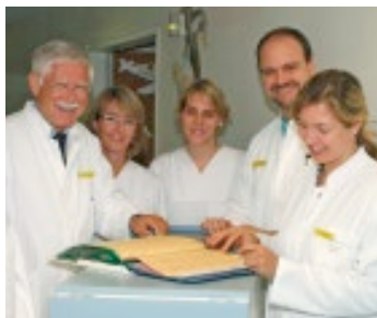
Visite auf der Station Sonneninsel

Die Universitäts-Kinderklinik ist ein Krankenhaus für Kinder und Jugendliche mit 115 Betten. Das Altersspektrum reicht vom Hochrisikofrühgeborenen mit weniger als 500 g Geburtsgewicht bis zum Jugendlichen mit akuten und chronischen Erkrankungen.