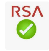
neues App Symbol